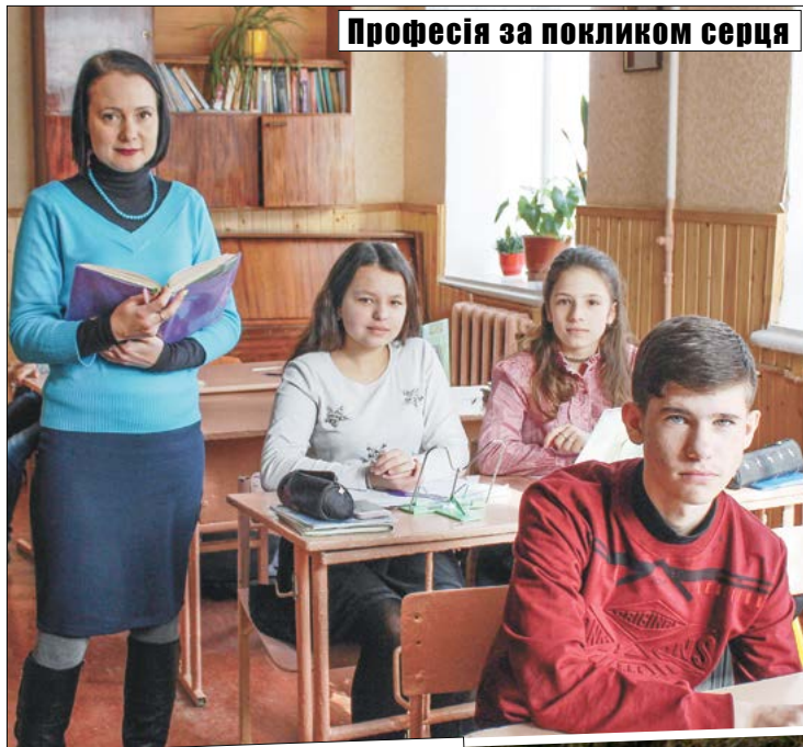
Професія за покликком серця